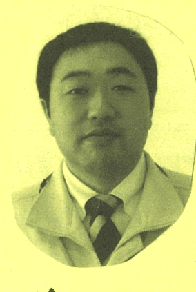
LA 柳枝 勲