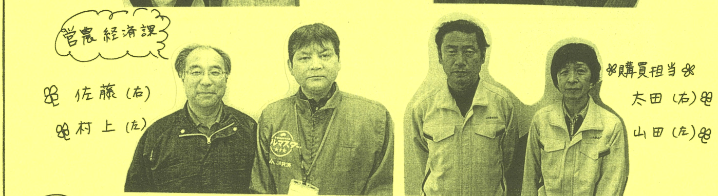
菅農 経済課 (Sato, Murakami, others)