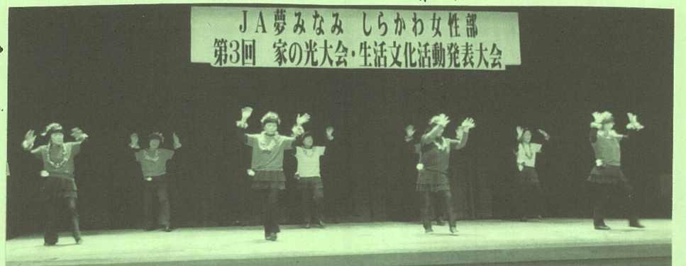
JA夢みなみ しらかわ女性部 第3回 家の光大会・生活文化活動発表大会