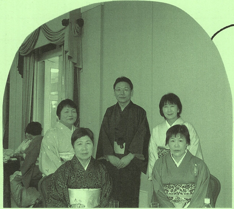
グランドエクシブにて