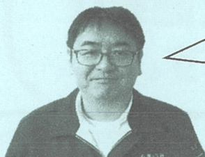
柳川サブ営農センター長

3月の定期人事異動により新しいメンバーで新年度がスタートしました！心機一転、新たな長沼支店としてチーム一丸となって、皆様の満足度向上に努めてまいります。地域に根ざした支店として、より一層信頼いただけるよう取り組んでまいります。今後よろしくお願いいたします。