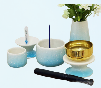
グラデーションブルー