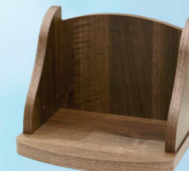
メモリアルステージ 2段