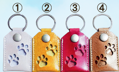
レザー遺毛ケース