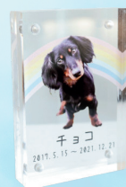
アクリルスクエア