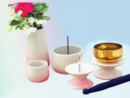
グラデーションピンク