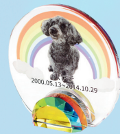
レインボークリスタル